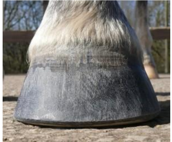
صورة للحافر السليم من الأمام

ب- بعض الأمثلة لحوافر الخيل التي بها بعض المشاكل: