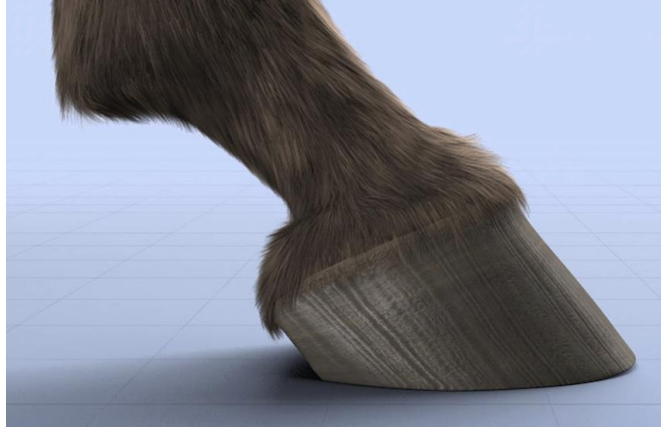
صورة جانبية تبين الحافر المقلم بشكل صحيح

من الضروري جداً معرفة شكل الحافر السليم و ذلك لتمييز أي مشاكل قد تطرأ على حوافر الخيل للاتصال بالطبيب البيطري مباشرة أو حذاء الخيل لعلاج المشكلة إن ظهرت. أ- الحافر الجيد :