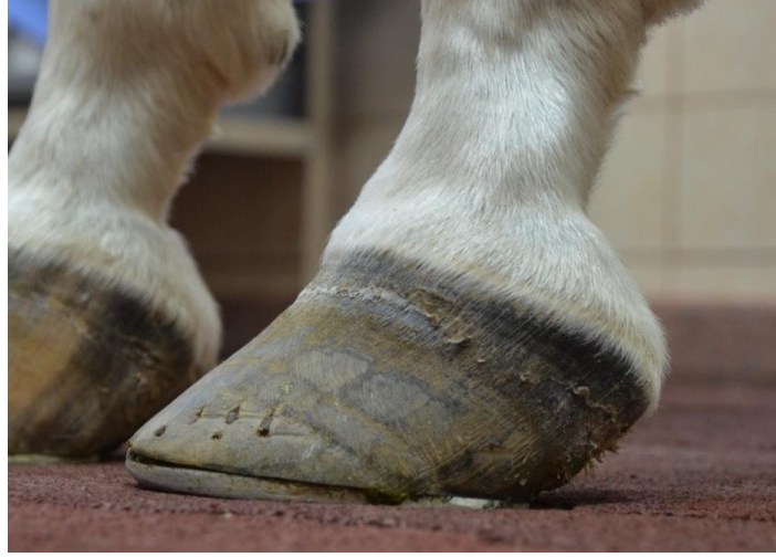
مثال لمقدم حافر خيل أكبر من الحدوة