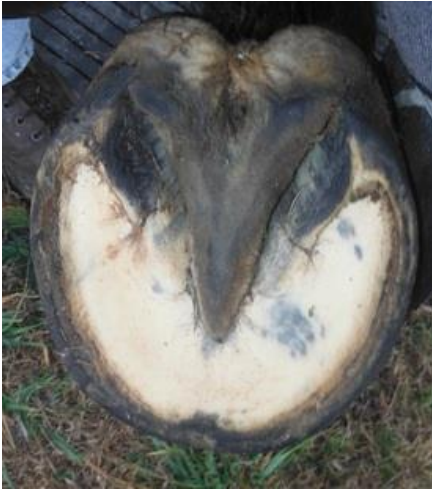
صورة لباطن الحافر السليم