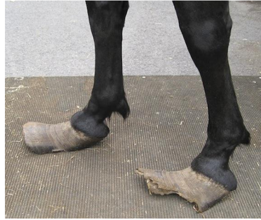
تشققات و تصدع الحافر مع زيادة طول مقدم الحافر