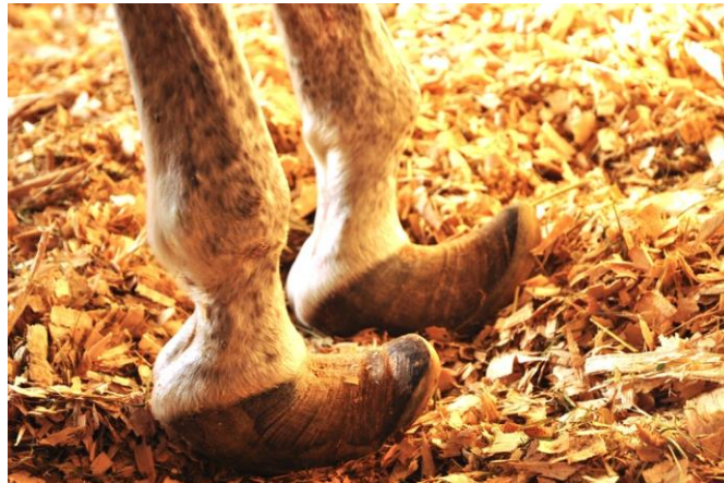
مثال لحوافر خيل مصابة بالحمرة مع النمو الزائد لمقدم الحافر

ب- بعض الأمثلة لحوافر الخيل التي بها بعض المشاكل: