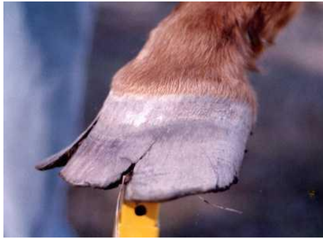
تصدع و تشقق جدار الحافر