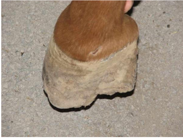
تشوه الحافر مع تصدعات و تشقق بكامل الحافر